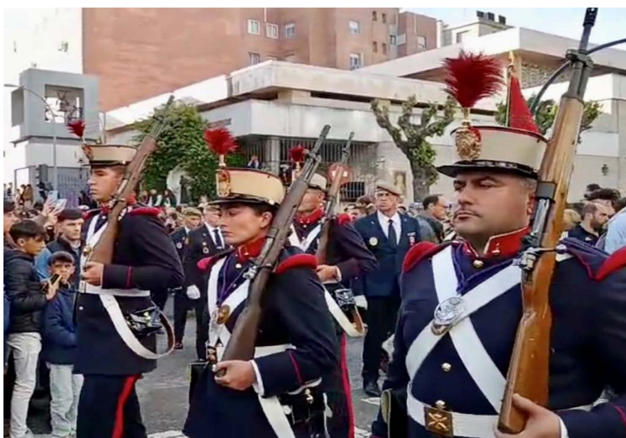
Escuadra de batidores del RAAA 74 a la salida del Templo