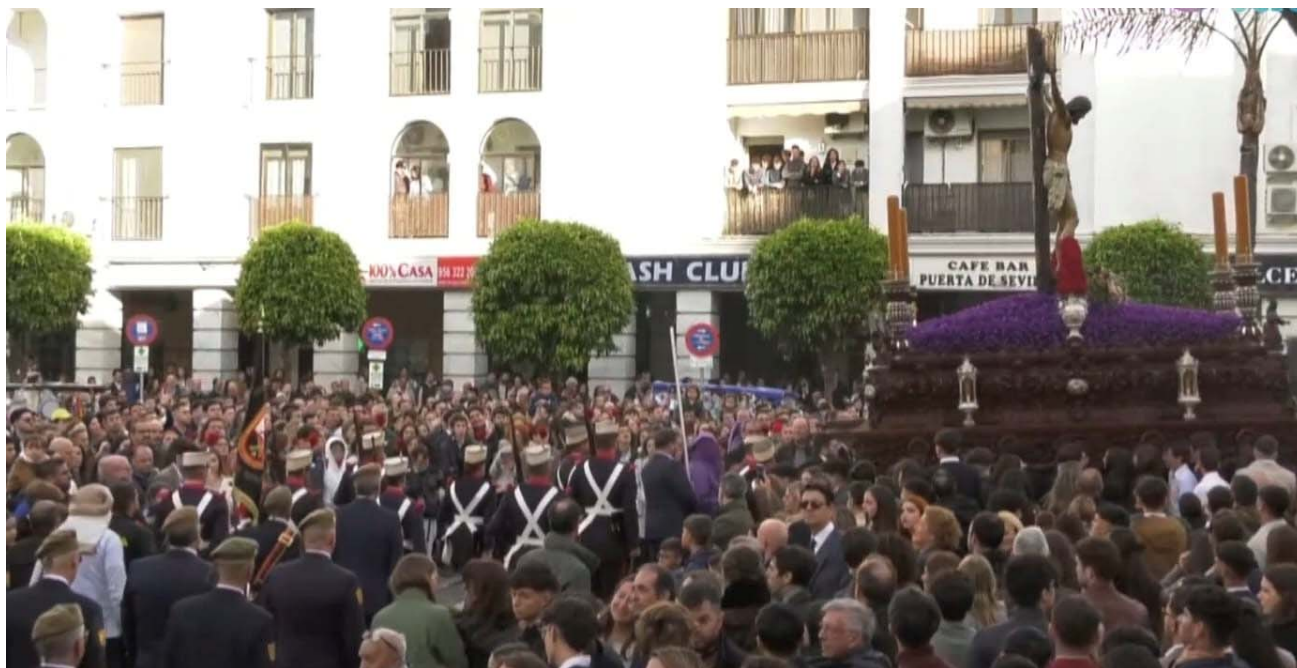
Cristo de la Defensión, escuadra de batidores y veteranos

Ya por la tarde, la Defensión como es conocida, hace su estación de penitencia por las calles de Jerez, la asociación ocupa un lugar de privilegio dentro del cortejo acompañando al Cristo precedidos por la Escuadra de Batidores de Artillería quienes le custodia hasta la santa catedral.