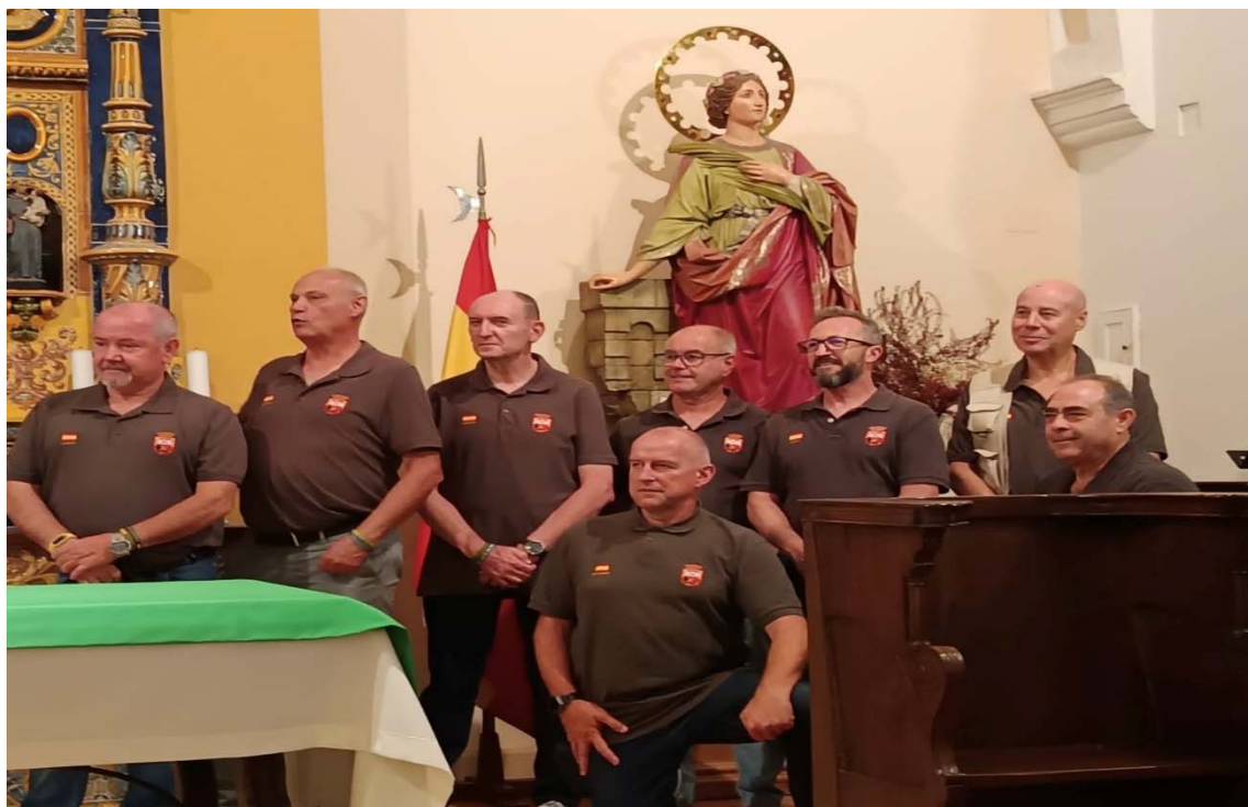
Miembros de la AVAE visitando la ACART