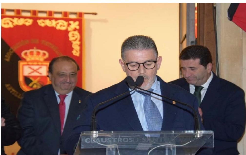
Nuestro presidente de dirige a los presentes en el acto inaugural