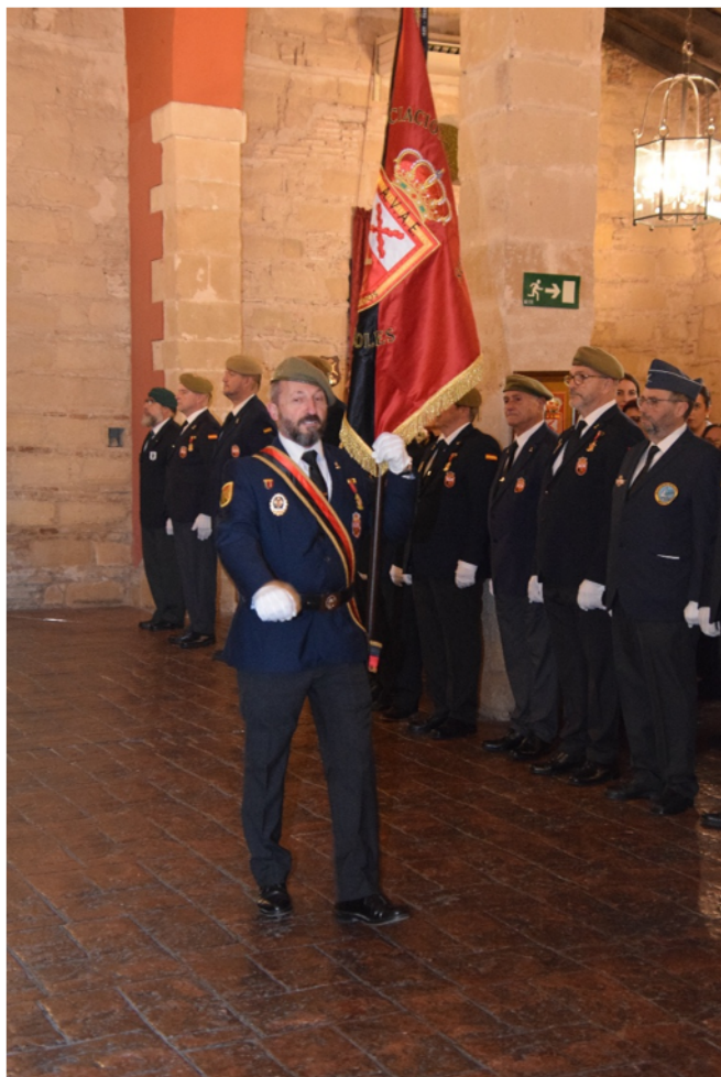
Entrada del guion de la AVAE