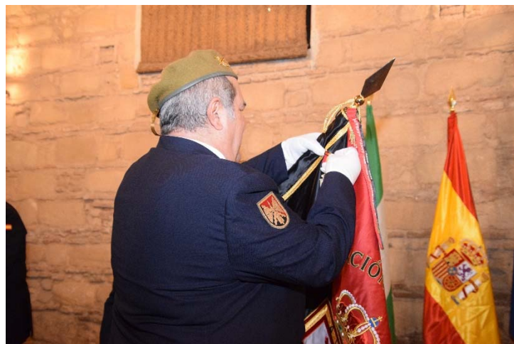
Imposición de la medalla de la Hdad. de Guardias Civiles Auxiliares